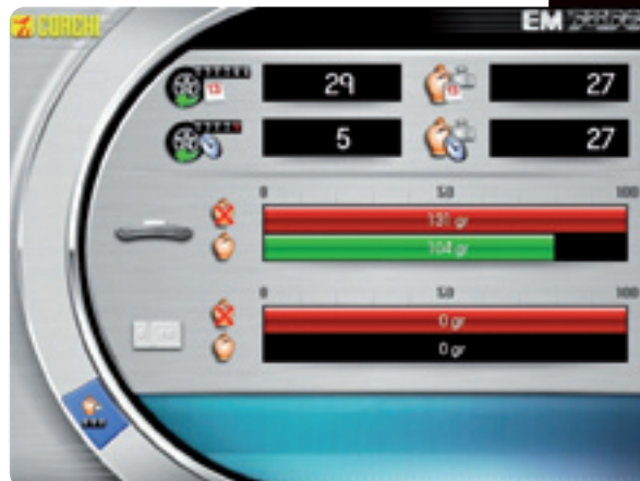
Bildschirmdarstellung der Statistik der Gewichtersparnis

Die Ersparniswerte werden automatisch errechnet und vom Programm angezeigt: