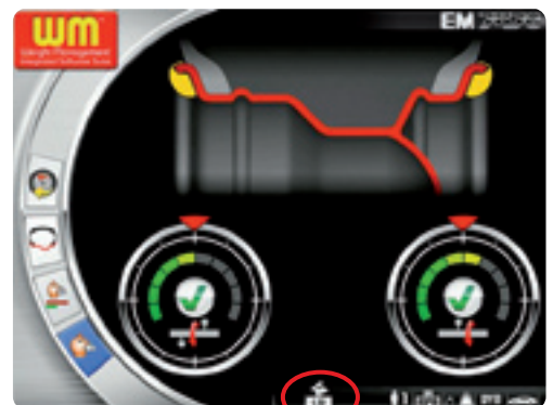
Bildschirmansicht der Auswahl schnelle Fahrzeuge (Hase)

Nur mit Less Weight werden diese Werte, Grundlage für die ideale Auswuchtung, vom Bediener ausgewählt , während das Programm alle anderen Parameter errechnet.