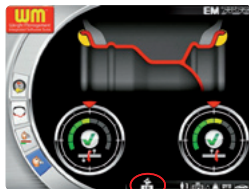
Ecrã de vídeo selecção dos veículos rápidos (lebre)

Apenas com Less Weight estes valores, fundamentais para a equilibragem ideal, são seleccionados pelo operador e automaticamente o programa calcula todos os outros parâmetros.