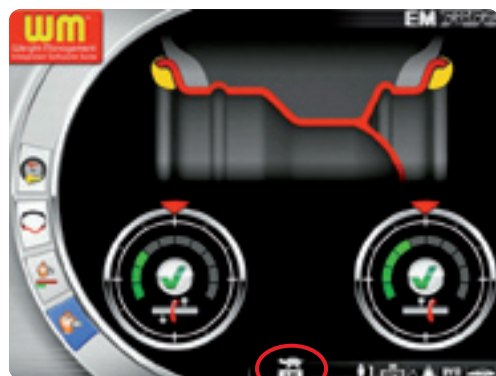
Ecrã de vídeo selecção dos veículos lentos (tartaruga)

Estes dois veículos podem apresentar, ademais, rodas similares para dimensões e peso e portanto similares momentos de inércia, mas seguramente (sendo o efeito do desequilíbrio proporcional ao quadrado da velocidade), necessitam de uma equilibragem diferente e específica.