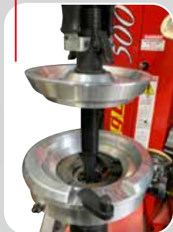
8-11100086 Kit de aros para van

Kit XL para caminhões leves, para furos grandes, alcance: 200-225 mm / 7,9"-8,8"