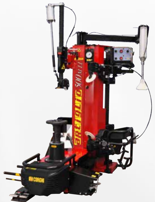
MONTAGEM DE RODAS COM AROS INVERTIDOS