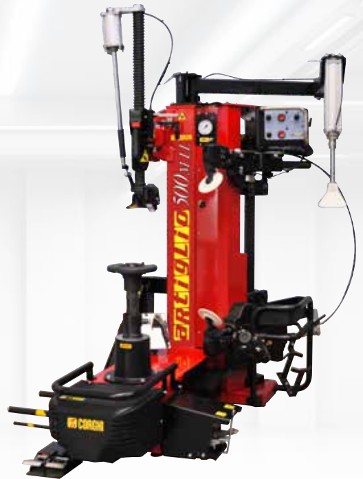
MONTAGEM DE RODAS PADRÃO

Uma solução inteligente para uma desmontadora de pneus compacta que pode ser instalada no interior de vans ou em oficinas com pouco espaço.