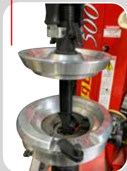
8-11100086 Kit cerchi furgone

Kit XL per autocarri leggeri, per fori di grandi dimensioni, gamma: 200-225 mm / 7,9"-8,8"