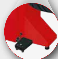
Pedale PNEULOCK PNEULOCK Pedal