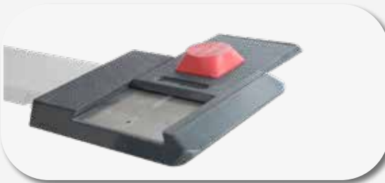
Soportes XY realizados de una aleación especial de aluminio Suportes XY realizados com uma especial liga de alumínio