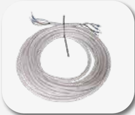
Set de cables 10 m Jogo de cabos 10 m.