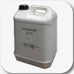
Aceite hidráulico 17 l Óleo hidráulico 17 l.