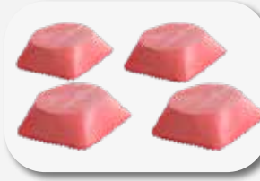
Set de toques de goma 40 mm, 120x120xØ100 (4 piezas) Jogo de tampões de borracha 40 mm, 120x120xØ100 (4 unidades).