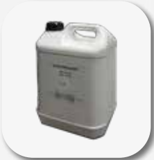
Aceite hidráulico 10 l Óleo hidráulico 10 l.